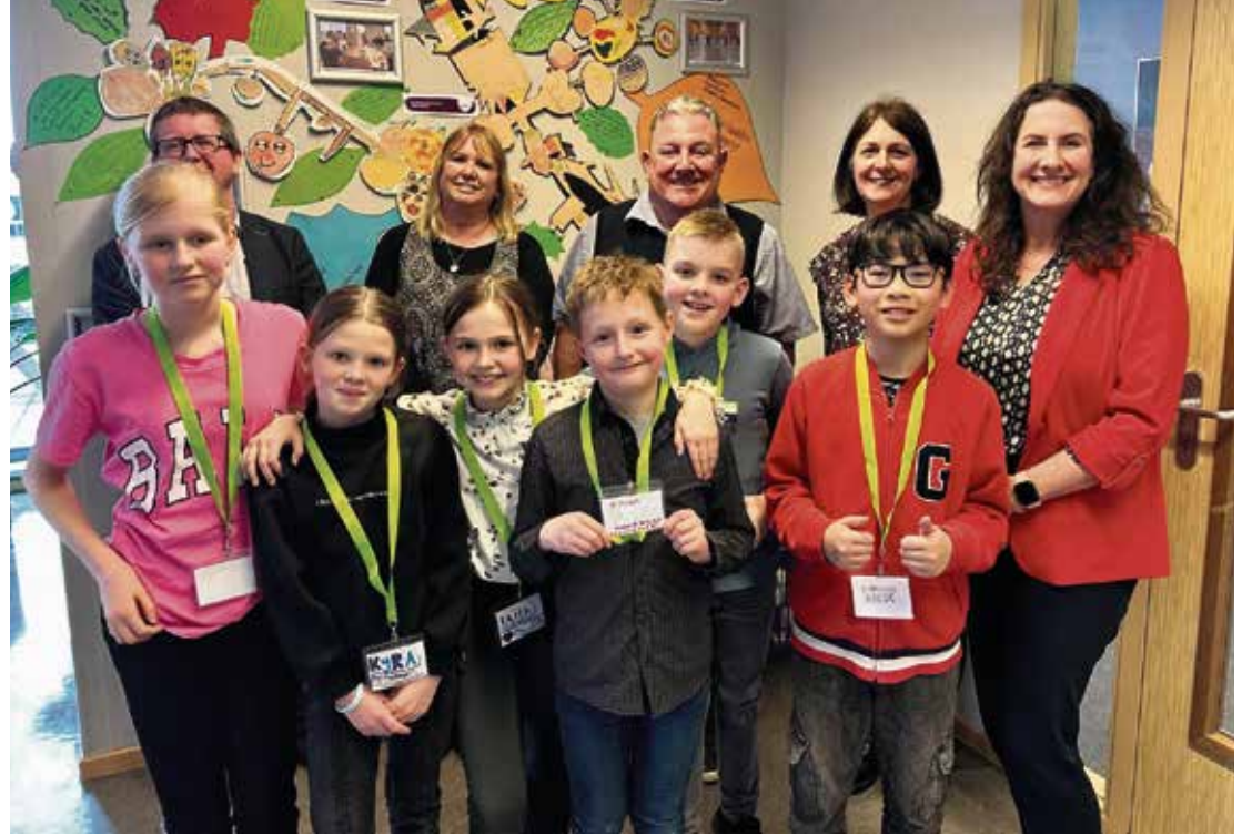
Engels bezoek aan de Windwijzer

Het samenwerkingsverband neemt alle indrukken en nieuwe ideeën mee in de verdere ontwikkeling naar inclusie in de regio.