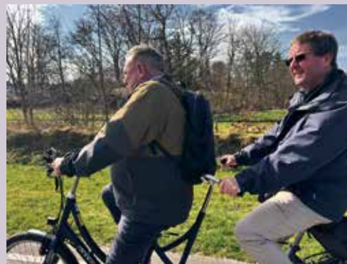
Op de tandem; fietsend van de Koog naar de Cocksdoorp op weg voor bezoek aan de Durperhonk